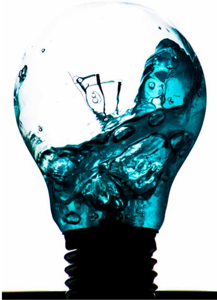
© JESÚS DUEÑAS LEZCANO 'Encerrando el mar'